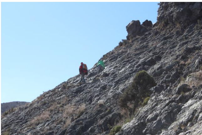
3. Tag Gipfletappe: Kraxelstelle mit Seilen gesichert.