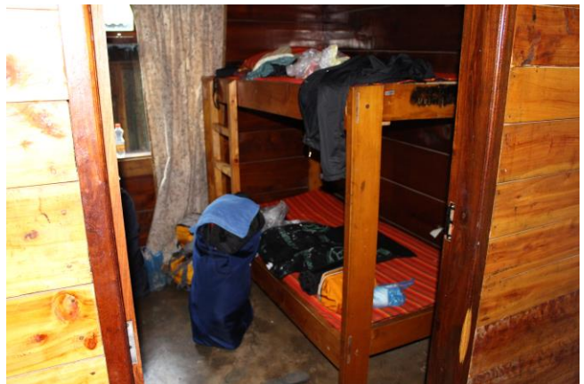
Unterkunft in der Miriakamba-Hütte.