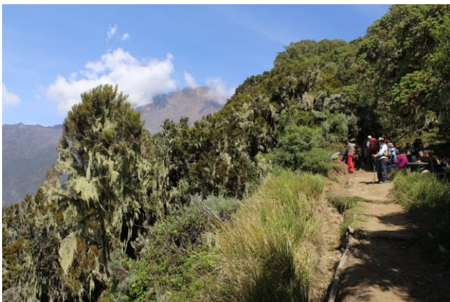
2. Tag: Unterwegs zur Sattel-Hütte.