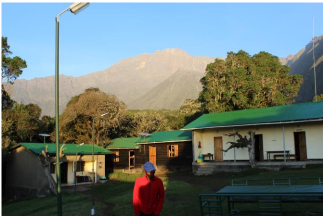
1. Tag: Miriakamba-Hütte mit dem Gipfel im Hintergrund.