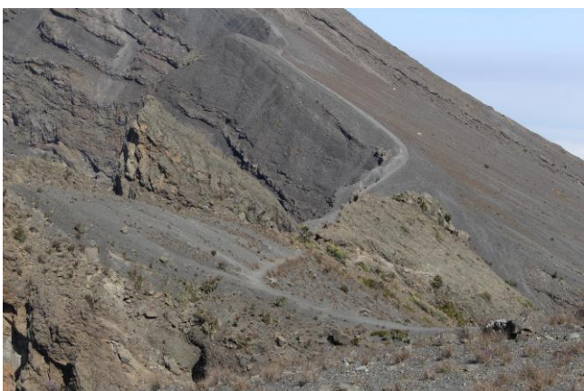
Gipfelmassiv mit schmalen, aber gutem, felsigem Weg.