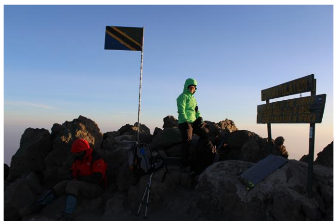
Der Gipfel des Mount Merus ist erreicht, 4565 m ü.M.!