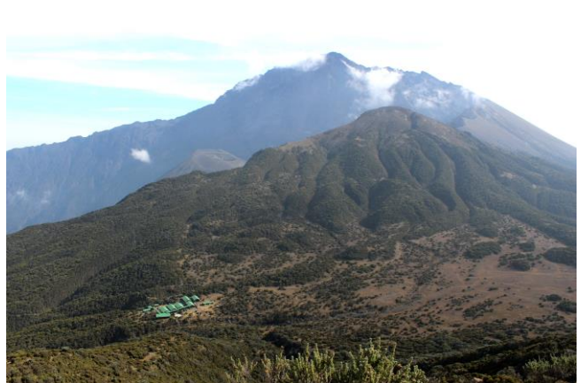
Sattel-Hütte mit Gipfel (-etappe) dahinter, fotografiert vom „Little Meru“.