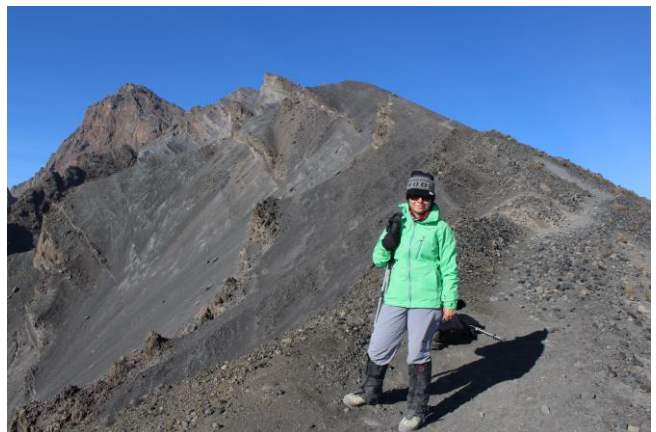
Gleich danach wird es wieder flacher, noch 2 Std. bis zum Gipfel.