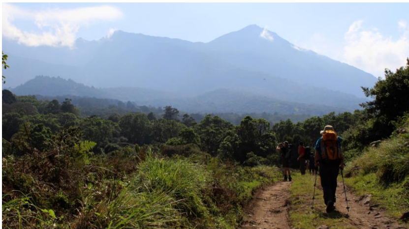
1. Tag: Ausblick auf Mount Meru

Ein paar Impressionen der Mount Meru-Besteigung: